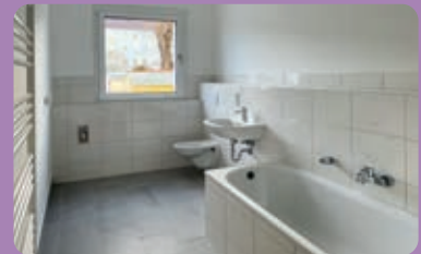
Klötzerstraße 16 - Badsanierung

Ende Januar 2023 wird das Haus nach der Komplettsanierung fertiggestellt und es erfolgt die Bauabnahme. Nach der Abstellung von Restmängeln sowie der Feinreinigung beginnt die Vermietung der Wohnungen ab 16.02.2023. Bis dahin soll auch der Zugang zum Haus barrierefrei hergestellt sein. Damit wurde auch der Bauablaufplan exakt eingehalten und trotz Materiallieferschwierigkeiten, Preissteigerungen und coronabedingte Ausfällen haben wir das Ziel mit hier ansässigen Firmen zur Neuvermietung des Hauses erreicht.